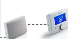
b) samostatná instalace