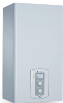
zařízení CHAFFOTEAUX – kotel, tepelné čerpadlo, ....

Servisu slouží webová aplikace ChaffoLink Manager , jejímž prostřednictvím může servis dohlížet na provoz zařízení a měnit některé parametry.