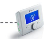
a) Wi-Fi jednotka jako základna pro Expert Control